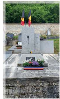
► Monuments aux morts de Port-Villez ◀