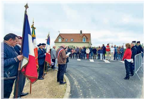
► Monument aux morts face à la salle des fêtes ◀